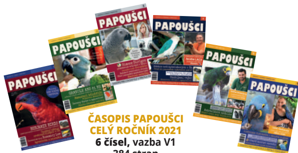
ČASOPIS PAPOUŠCI CELÝ ROČNÍK 2021 6 čísel, vazba V1 384 stran 450 Kč 174 Kč