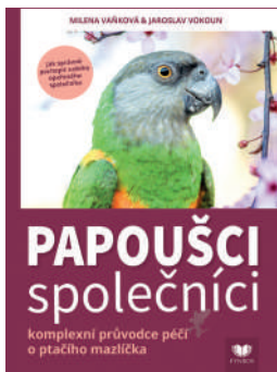
PAPOUŠCI SPOLEČNÍCI Vázaná kniha 208 stran 499 Kč 450 Kč