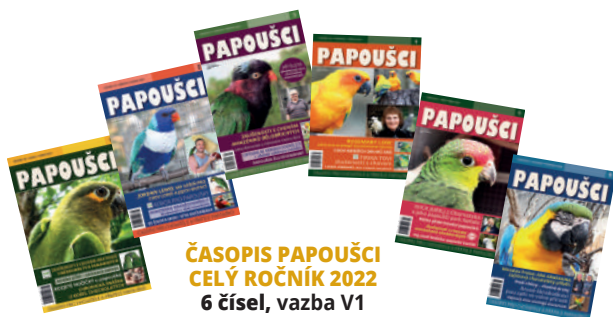
ČASOPIS PAPOUŠCI CELÝ ROČNÍK 2022 6 čísel, vazba V1 384 stran 450 Kč 330 Kč