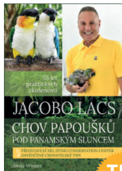
CHOV PAPOUŠKŮ POD PANAMSKÝM SLUNCEM Vázaná kniha 336 stran 690 Kč 590 Kč