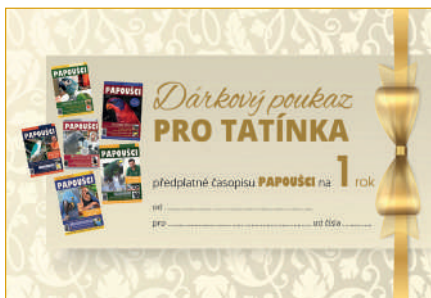
TÉMATICKÉ DÁRKOVÉ POUKAZY - TIŠTĚNÉ ROČNÍ PŘEDPLATNÉ ČASOPISU PAPOUŠCI + 1 x časopis PAPOUŠCI + dárková taška 474 Kč