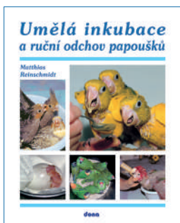
UMĚLÁ INKUBACE A RUČNÍ ODCHOV PAPOUŠKŮ