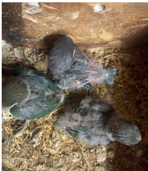
Rozdíl mezi *tyrkysovým* a modrým, srovnání mladých v hnízdě