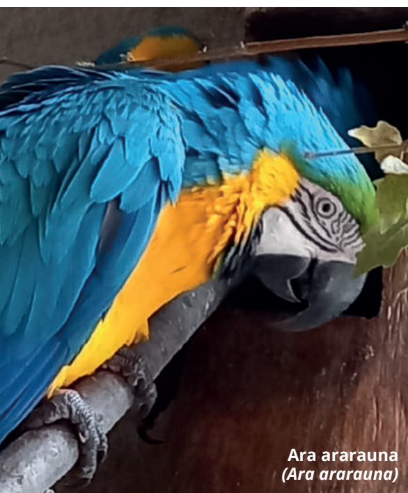
Ara ararauna (Ara ararauna)

Text: Milena Vaňková, Alena Čičmancová • Foto: Alena & Monika Čičmancovy