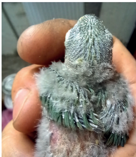
Rašící pírka u mladého agapornise - zbarvení už je patrné

Zdravím všechny čtenáře časopisu Papoušci. Poslední informace vyšla v čísle 2/2019, kdy jsme vám představili odchov mutace SF Euwing violet D modrý. Nyní bych vás rád informoval o úspěšném odchovu *tyrkysové* mutace u agapornisů hnědohlavých.